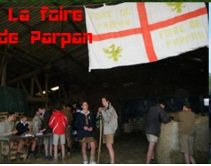
La foire de Parpan