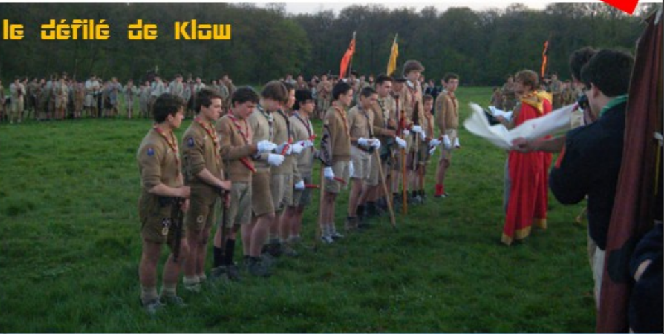
le défilé de Klaw